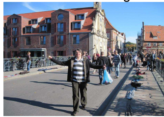
Am Hafen in Lüneburg