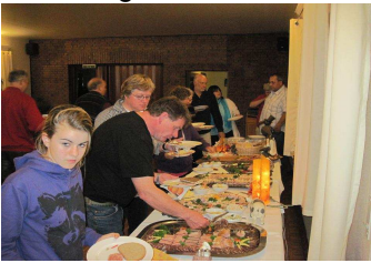
Schlachteplatte im Landgasthof Sprengel