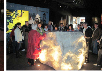
Samstag Salzmuseum Lüneburg