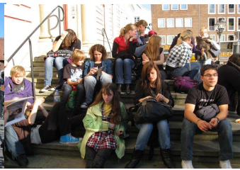
Warten auf den Bus