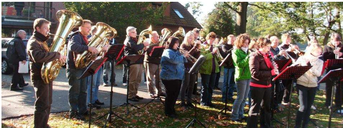
Gemeinsames Sonntagskonzert MC Bickenbach und Blaskapelle Hemslingen

An diesem Wochenende schrieben wir Vereinsgeschichte. Wetter top, Laune top, super Organisation, Dank allen Helfern aus Hemslingen und Söhlingen. Es war keine Steigerung möglich. (Speer)