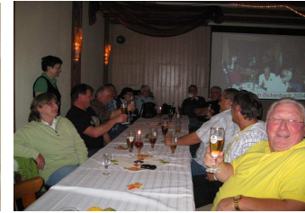
Anschließend gesellige Runde