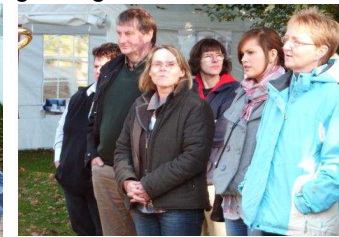
Gasteltern lauschen dem Konzert