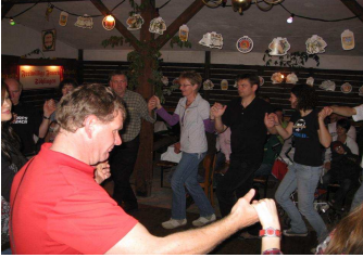
Hamburger Bunter Hessen sind lernfähig