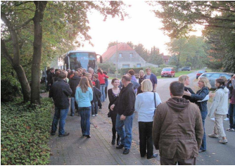
Ankunft bei frischer Landluft