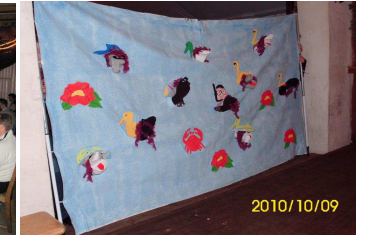
Die tanzenden Socken bei Holtermann